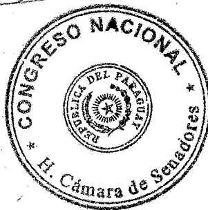
Fernando Lugo Méndez Presidente H. Cámara de Senadores

Al Excelentísimo Señor Horacio Manuel Cartes Jara Presidente de la República Poder Ejecutivo